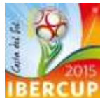
TABELA DE PROMOÇÃO ESPECIAL

Valores promocionais válidos para inscrições com um pagamento de sinal (1000€ por equipa) até dia 20 de Outubro 2014 . A promoção contempla também a oferta no pacote escolhido para 1 responsável por cada Equipa (para um mínimo de 16 participantes).